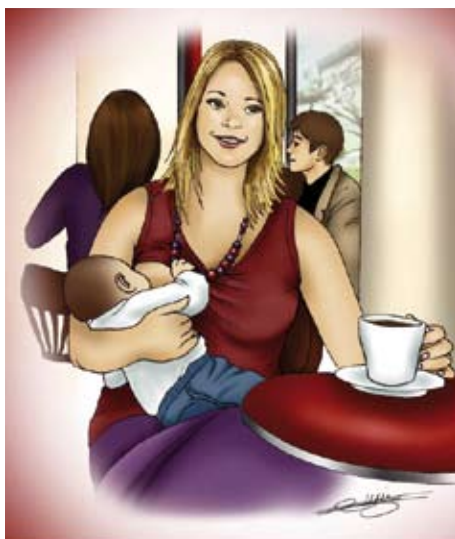
■ Allaiter à l'extérieur

Seuls ceux que bébé n'aime pas sont à éviter.