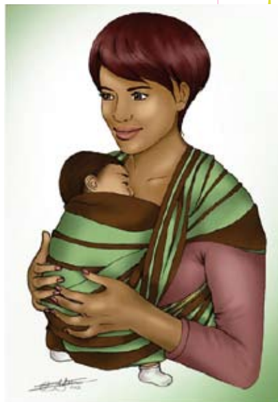
■ L'écharpe de portage

Pendant cet apprentissage, vous allez repérer les rythmes de sommeil et d'éveil de votre enfant, plus courts que ceux de l'adulte. Lors de la tétée, les aînés peuvent se sentir mis à l'écart. Ils apprécieront que vous