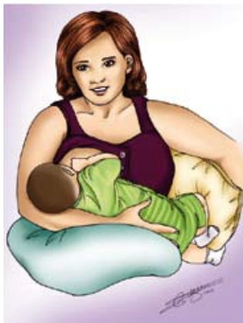
■ La madonne ou la berceuse