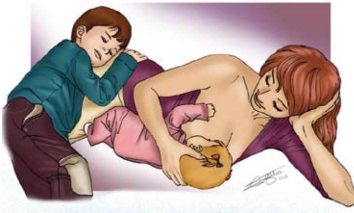
■ Allongée sur le côté sein extérieur