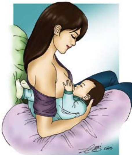
■ Le ballon de rugby

Pour accélérer la cicatrisation, vous pouvez étaler une goutte de lait en fin de tétée voire de la crème à base de lanoline. Quand ces mesures simples ne suffisent pas, certaines femmes sont soulagées par l'utilisation de protège-mamelons en silicone de taille adaptée. Ils peuvent parfois entraîner une moins bonne stimulation et perturber la succion du bébé, leur utilisation devrait rester exceptionnelle et temporaire.