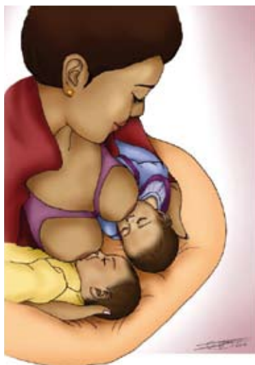
■ Allaiter des jumeaux

Dans tous les cas, avoir des jumeaux demande beaucoup de disponibilité. Les mères ont besoin de soutien, d'encouragements et de détermination.